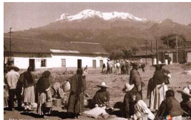
Pie de imagen o gráfico.

Además Ameca cuenta con tradición en sus cenadurías en las que acuden las familias para saborear un rico pozole, tostadas, sopes, tacos, enchiladas. El menudo es un alimento que muy de mañana se puede encontrar por distintas zonas de la ciudad. Se elaboran ricos panes conocidos como "picones" que resultan del gusto de propios y extraños.