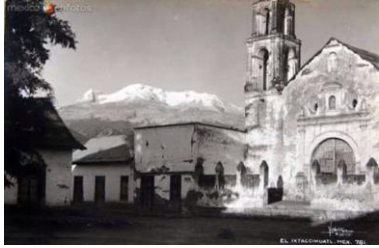
Iglesia de Amecameca

La palabra Amecameca, que originalmente fue Amaquemecan, proviene del idioma náhuatl o mexicano. Sus raíces son los vocablos amatl, que quiere decir papel; queme, que significa señalar o indicar y can que se traduce como lugar. Por lo tanto, Amaquemecan significa "el lugar donde los papeles señalan o indican". El municipio de Amecameca está situado en las faldas de la Sierra Nevada, dentro de la provincia del eje volcánico y en la cuenca del río Moctezuma-Pánuco. Sus coordenadas geográficas son longitud 98°37'34" y 98°49'10"; latitud 19°3'12" y 19°11'2". La altura sobre el nivel del mar es de 2,420 metros en la cabecera municipal. Se ubica en la porción sur del oriente del Estado de México. En la Región III Texcoco. Los límites del municipio son: al norte, el municipio de Tlalmanalco; al este el estado de Puebla; al sur, los municipios de Atlautla y Ozumba; y al oeste, los municipios de Ayapango y Juchitepec.